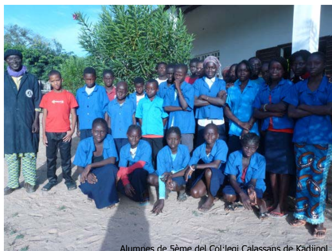
Alumnes de 5ème del Col·legi Calassans de Kadjinol