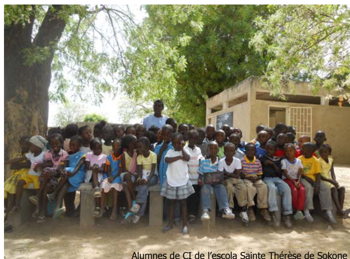
Alumnes de CI de l'escola Sainte Thérèse de Sokone