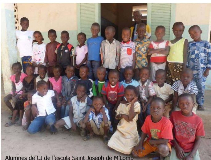
Alumnes de CI de l'escola Saint Joseph de M'Lomp