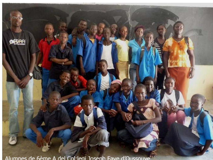
Alumnes de 6ème A del Col·legi Joseph Faye d'Oussouye